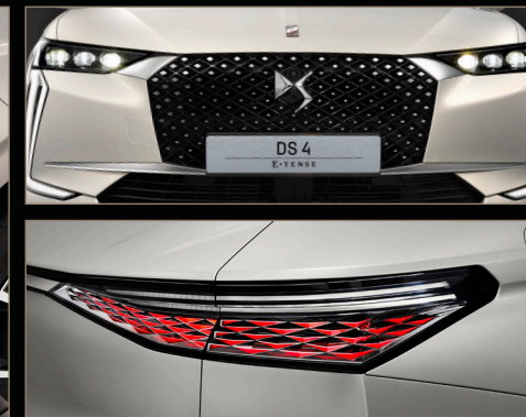
PHOTO:DS 4 E-TENSE