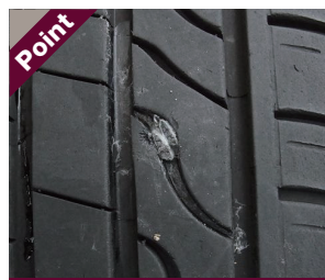
Point 釘やガラスなど金属片がタイヤに刺さっている

上図のような劣化が見えたら、安全面での性能が保証されないため、交換をおすすめします。