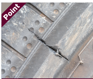
Point トレッド面、サイドウォール部分などに切り傷