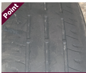
Point トレッド面の一部がツルツルな状態(偏摩耗)

地面と接している部分が、しっかりと路面をつかめなくなると、ブレーキやハンドリングに影響が出てしまい、燃費などにも影響を与えます。