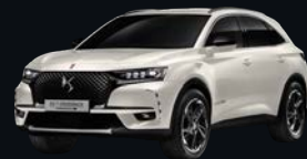
クリスタル パール