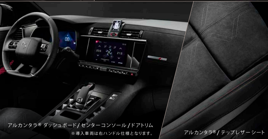
アルカンタラ® ダッシュボード/センターコンソール/ドアトリム ※導入車両は右ハンドル仕様となります。