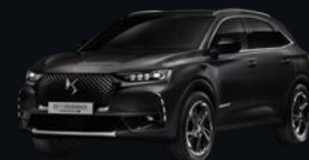
ノール ペルラネラ